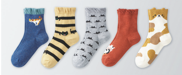
『口ゴムゆったりねこまみれソックス』

靴下製造総合卸「三笠」の靴下在庫一掃セールが上記の日程で開催されます。毎日違う柄を楽しめる5柄セットのねこまみれソックスや、ふわふわボリュウムが気持ちいいマッシュマロタッチのふわもこソックスなど、人気の品を多数用意しています。年に一度の在庫処分5～9割引の超お買い得商品をお見逃しなく。《2000円以上購入すると、プレゼントも！》