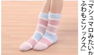
『マッシュマロみたいなのふわもこソックス』