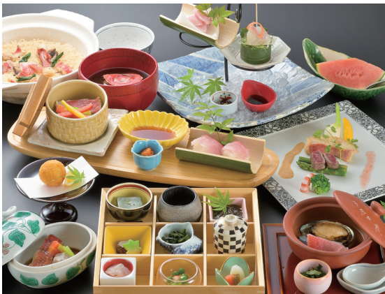
▲『金目鯛の特別懐石』8,800円(税込)

武田信玄公銅像 甲府駅前にある武田信玄公の銅像は、甲府市・山梨県のシンボルとして、多くの観光客が訪れる記念スポットです。